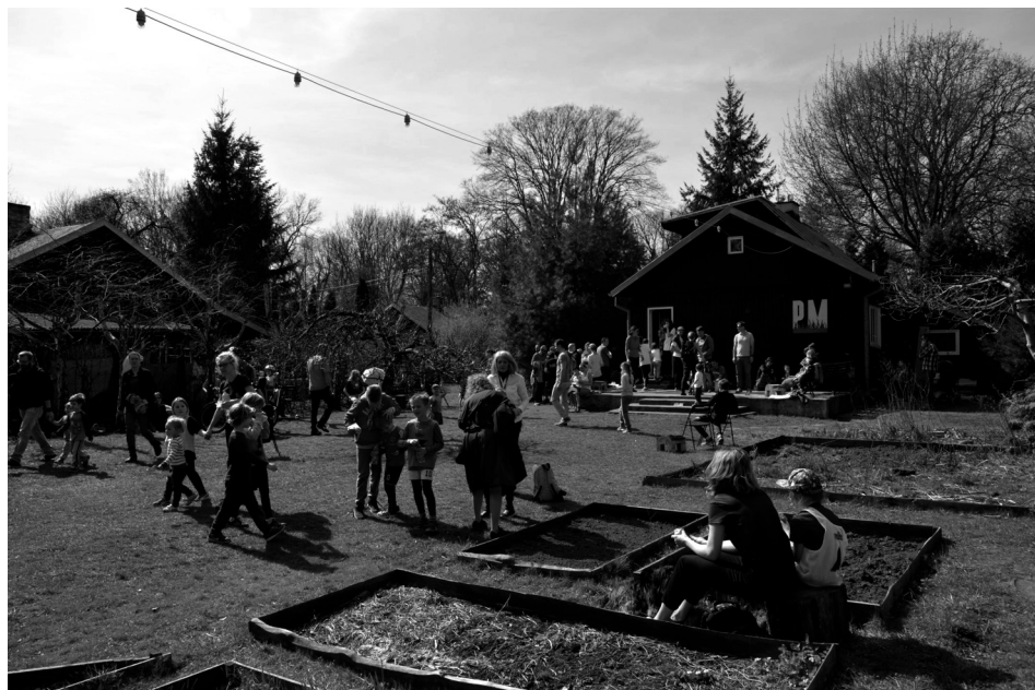
Ryc. 4. Domek nr 3/12 – PM na Trawie