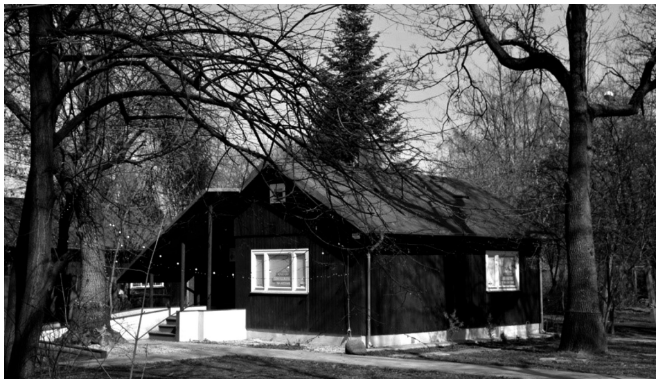
Ryc. 3. Jeden z zachowanych domków – obecnie Rotacyjny Dom Kultury

Osiedle 90 drewnianych domków fińskich na warszawskim Jazdowie oddano do użytkowania w 1945 r. Prefabrykowane części domków przekazał zniszczonej stolicy Związek Radziecki, który stał się ich posiadaczem w wyniku realizacji reparacji wojennych przez Finlandię. Pochodzenie domków utrwalone zostało w nieformalnej nazwie osiedla (Kunceka, Kunecki 2015). W domkach zakwaterowano głównie pracowników Biura Odbudowy Stolicy. Planowany okres ich eksploatacji ustalono na 10 lat (Majewski 2011). Po upływie dekady domki były jednak dalej użytkowane w celach mieszkaniowych (mieszkania komunalne), ale temat ich rozbiórki wracał. Przykładowo w tygodniku „Stolica” z 1963 r. ukazał się artykuł o nowym projekcie zagospodarowania m.in. obszaru kolonii domków na Jazdowie. Zapisano w nim „Domki fińskie na Ujazdowie w początkach roku 1945 były bezcennym skarbem w zniszczonej Warszawie. Niedługo ustąpią śmiałym budowlom miasta nowoczesnego” ( Od Placu... 1963, s. 5). W związku z realizowanymi inwestycjami domki sukcesywnie więc rozbierano (budowa ambasad, Trasy Łazienkowskiej). Miasto prowadziło też nastawioną na dekapitalizację osiedla politykę wobec najemców domków, polegającą m.in. na braku większych remontów i napraw w obiektach. Znaczną część prac na własny koszt wykonywali ich mieszkańcy (wywiad