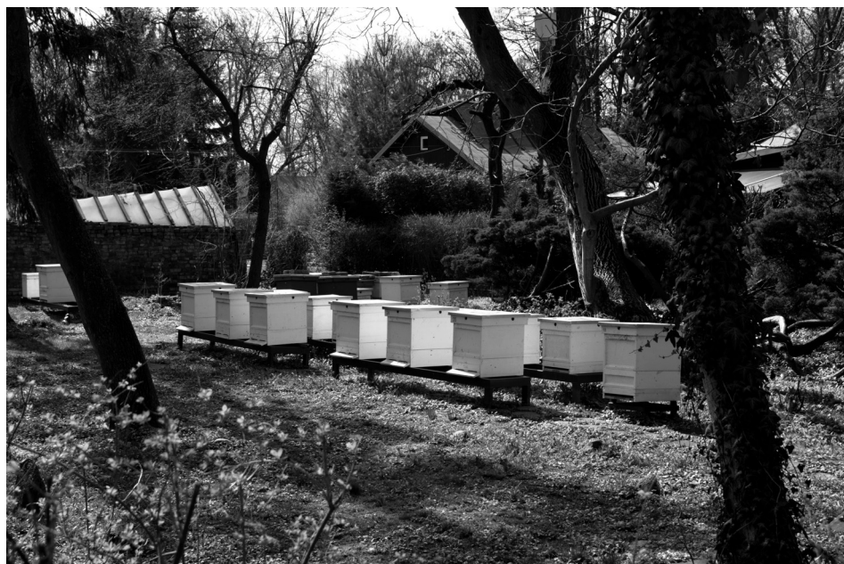
Ryc. 5. Miejskie Pszczoly (pasieka przy domku nr 3/8)